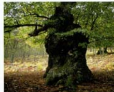
Castaño centenario de el Resecadal

Continuando por el camino discurriríamos paralelos al arroyo de la garganta de la Yedra, con agua todo el año y con una hilera de alisos que formando un pequeño bosque de galería, serpentean junto al arroyo. Llegamos a la explanada denominada las Praderas de Garrido donde siguiendo el camino giraremos hacia la izquierda para, atravesando un pequeño rebollo, desembocar en el paraje conocido por "el castañar del Resecadal" donde podemos apreciar varios ejemplares de castaños de gran tamaño que parecen acompañarnos y resguardarnos hasta llegar al "castaño del Codao". Este árbol nos muestra un aspecto muy característico de los castaños: su viejo tronco central ya muerto pero del que surgen rodeándolo múltiples rebrotes en "corona", sus vástagos creciendo con vigorosa fuerza. Descendemos ahora por una zona con mayor pendiente en la que el camino se hace más sinuoso y el bosque aparece salpicado de rocas graníticas para salir a la bifurcación inicial desde donde, tomando el camino de la derecha, regresaremos al área recreativa y al principio de la ruta.