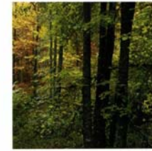
Bosque de castaños, alisos y avellanos

Continuando por el camino discurriríamos paralelos al arroyo de la garganta de la Yedra, con agua todo el año y con una hilera de alisos que formando un pequeño bosque de galería, serpentean junto al arroyo. Llegamos a la explanada denominada las Praderas de Garrido donde siguiendo el camino giraremos hacia la izquierda para, atravesando un pequeño rebollo, desembocar en el paraje conocido por "el castañar del Resecadal" donde podemos apreciar varios ejemplares de castaños de gran tamaño que parecen acompañarnos y resguardarnos hasta llegar al "castaño del Codao". Este árbol nos muestra un aspecto muy característico de los castaños: su viejo tronco central ya muerto pero del que surgen rodeándolo múltiples rebrotes en "corona", sus vástagos creciendo con vigorosa fuerza. Descendemos ahora por una zona con mayor pendiente en la que el camino se hace más sinuoso y el bosque aparece salpicado de rocas graníticas para salir a la bifurcación inicial desde donde, tomando el camino de la derecha, regresaremos al área recreativa y al principio de la ruta.