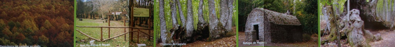
Panorámica del castañar en otoño