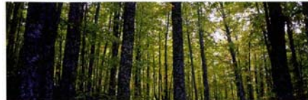
El Castañar en primavera

El trazado de esta senda nos permitirá explorar y conocer uno de los bosques más hermosos y singulares de la comarca: el "Castañar de El Tiemblo", verdadero orgullo de los tiembles y el de mayor extensión del Sistema Central. Nos encontramos en la cabecera de la garganta de la Yedra, donde los bosques mixtos de roble melojo o rebollo y castaño dan paso a una masa pura de esta especie, el castaño ( Castanea sativa ), árbol caducifolio que pudo ser introducido o al menos favorecido y difundido en la península en épocas romanas y que se ha adaptado en numerosos lugares de nuestro territorio, en parte debido a la importancia que su fruto, las castañas, representaban antaño en la dieta alimenticia de las poblaciones. A lo largo de la ruta podremos observar diferentes especies de árboles y arbustos que acompañan al castaño o forman parte del sotobosque del castañar (majuelo, avellano, olmo de montaña, cerezo silvestre, sauces, acebo, arracién, abedul, brezos, helechos...); así como algunas especies de aves de carácter forestal (arrendajo, trepador azul, mirlo, zorzal, etc.).