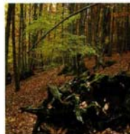
Interior de El Castañar en otoño

Atravesaremos el bosque aprovechando el camino que parte del área recreativa de El Regajo. Desde el comienzo de la senda transitamos entre jóvenes castaños de troncos rectos y espigados, dejando a la derecha una vaguada con avellanos, zarzas y rosales silvestres. Pasada la fuente de los Cazueleros encontraremos un mojón con una bifurcación del camino; seguiremos hacia la derecha para, tras una suave y corta ascensión, llegar a una explanada donde el bosque se abre y se encuentra el Refugio de Majalavilla. En esta zona podemos observar varios castaños de gran porte, y un poco más adelante una pequeña senda nos lleva primero a un pino resinero ( Pinus pinaster ) de considerable tamaño y poco después hasta "El Abuelo", monumental castaño centenario, de enorme perímetro y sugerente silueta, del que comentan los viejos del lugar que su tronco hueco es capaz de dar cobijo a todo un rebaño de cabras, y que se encuentra dentro del Catálogo de Especímenes Vegetales de Singular Relevancia de Castilla y León.