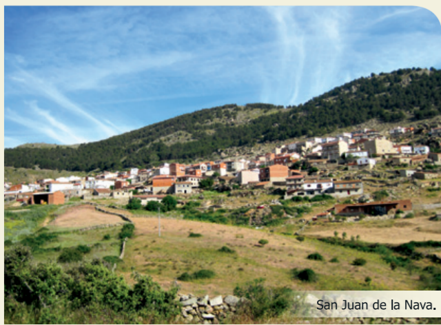
San Juan de la Nava.

Se inicia en Navalunga por la calle El Sestil. El primer tramo corresponde a una pista de tierra en buen estado que discurre entre muros de piedra seca ("Camino de El Barraco a Navalunga"), y asciende de forma constante por relieves alomados y fracturados. Existen dos posibilidades, la primera nos lleva hasta San Juan de la Nava por el llamado "Camino del Chorro" y desde esta localidad a El Barraco por el sendero GR 10.3. La segunda opción atraviesa el Monte El Encinar, enlazando con el Cerro Morrucco (PR-AV 34), hasta la localidad de El Barraco, final de la etapa.