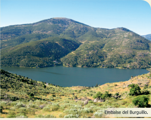
Embalse del Burguillo.

La ruta se inicia en la localidad de El Tiemblo. Se toma la calle cementada que desciende hasta la presa del Embalse del Charco del Cura. Más adelante, el itinerario aprovecha una senda por la margen izquierda del embalse, para enlazar con el sendero GR 10. Por la antigua carretera N-403 se atraviesa la presa del Embalse del Burguillo. El último tramo se realiza por la pista asfaltada (GR 10) que lleva hasta Las Cruceas (Casa del Parque de la Reserva Natural del Valle de Iruelas) o bien hasta el camping, final de la primera etapa.