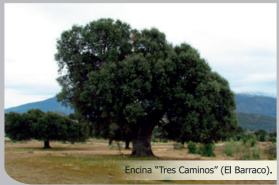
Encina "Tres Caminos" (El Barraco).

Se vuelve por el mismo camino de la anterior etapa y se toma el sendero PR-AV 33 que atraviesa el Monte El Encinar. Más adelante se cruza la carretera N-403 y se enlaza con el sendero GR 10.3 ("Camino de Valdelatas" y "Camino del Macho"). Se desciende hasta cruzar el Puente de Remajarina, sobre el río Gaznata. A continuación, se bordea la margen izquierda del Embalse del Burguillo, hasta que se toma una pista de tierra que asciende hasta la Urbanización "Arroyo de la Parra". A continuación se enlaza con el Mirador de la Gaznata y desciende hasta el camino de la cantera. Por último, la ruta conecta con la antigua carretera N-403 y sigue, por el Embalse del Charco del Cura, el mismo trazado de la etapa 1 hasta la localidad de El Tiemblo.