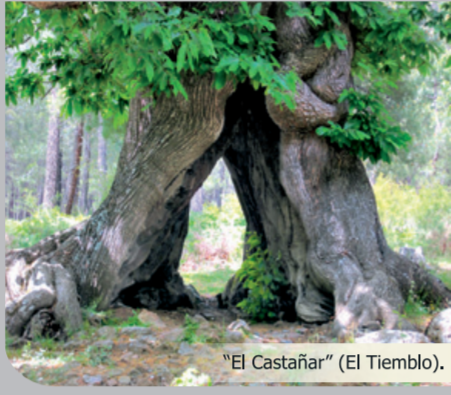
"El Castañar" (El Tiemblo).

Exigente etapa de gran longitud y desnivel, recomendada solamente para senderistas habituados a la montaña y de gran condición física. Desde la localidad de El Tiemblo (C/Maestro Zarate) la etapa discurre por la pista asfaltada en dirección a El Castañar (3,5 km). Se toma la "Senda de San Gregorio" (PR-AV 52) hasta el área recreativa "El Regajo". Posteriormente, por la senda de "El Castañar" (PR-AV 54) se enlaza con el área recreativa "Las Barrancas" y en fuerte pendiente se alcanza el Pozo de la Nieve y Puerto Casillas (PR-AV 21), mirador privilegiado de la Reserva Natural del Valle de Iruelas. Por último, se desciende por la pista forestal principal del fondo de la Garganta, bien hasta la Casa del Parque (Las Cruceas) o bien hasta el camping Valle de Iruelas.